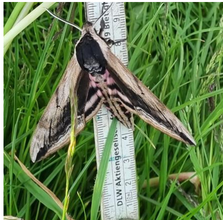
Nærværende insekt blev spottet ved klubben ved familiehunde træning. Det skulle være en Ligustersværmer.