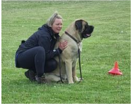
Dagen slutter med massage/afslapning