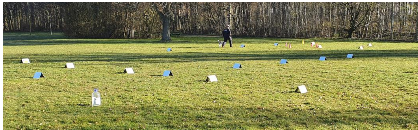
Øvet hold – baneopstilling ved Frilandsmuseet