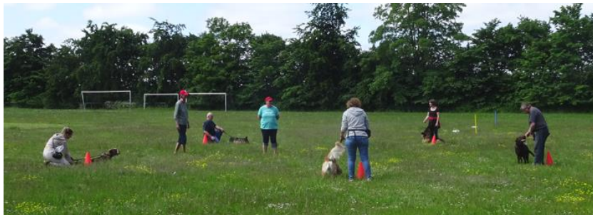
Samling ved kegler