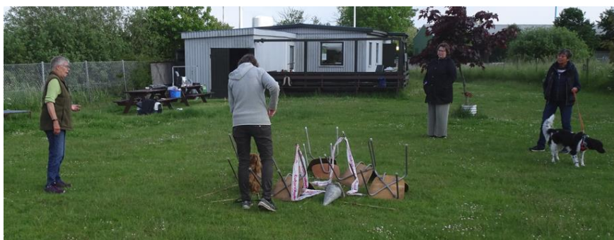
Fra sidste træningsdag i foråret