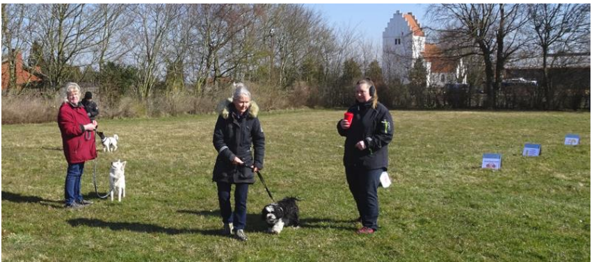
Hold for nye/let øvede