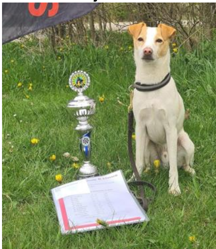
2. plads op rykning til kl. A er sikret