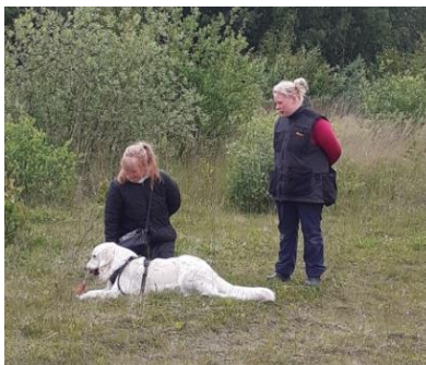
Fifty, Heidi og Ramona