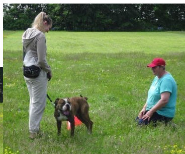
Fra sidste træningsdag i foråret (hold 2)