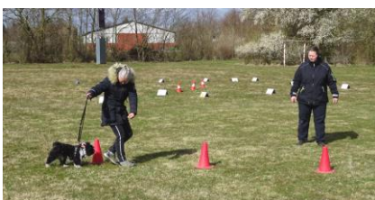
Hold for nye/let øvede