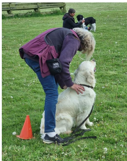
Dagen slutter med massage/afslapning