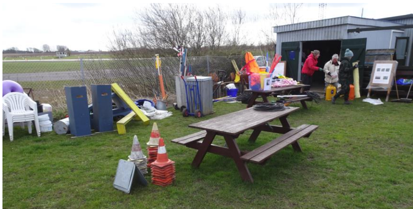
Alt blev flyttet ud af skuret – en del blev kasseret.