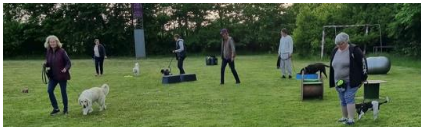
Fra sidste træningsdag i foråret