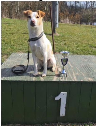
BoBo. 1. plads