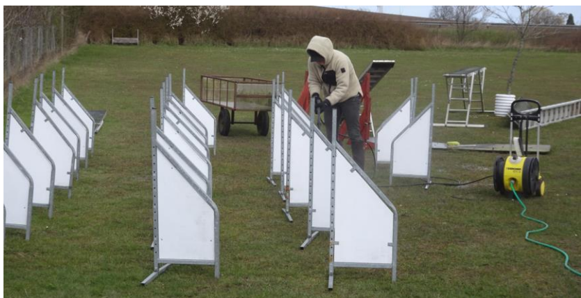
Berit var mester for at styre højtryksspuleren med fint resultat. Stor tak til alle der var mødt frem.