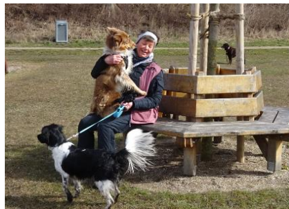
Ib synes at han skulle hygge lidt.