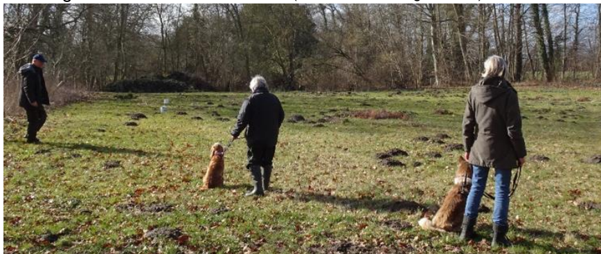
Træning på det åbne areal

Træning i Østofteskoven 14. marts