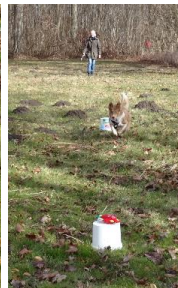
Ib og Ulla – dæk og fremsendelse (Ib mente at spande skulle med tilbage)