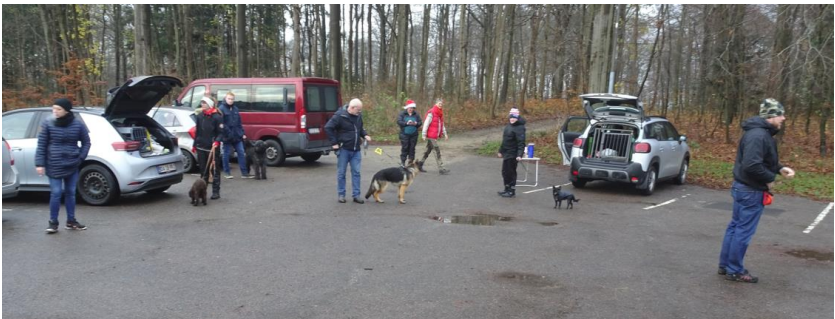
Sidste træning før julepausen – der er 3 gange træning tilbage i det nye år