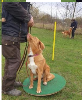
Tinka og Bo