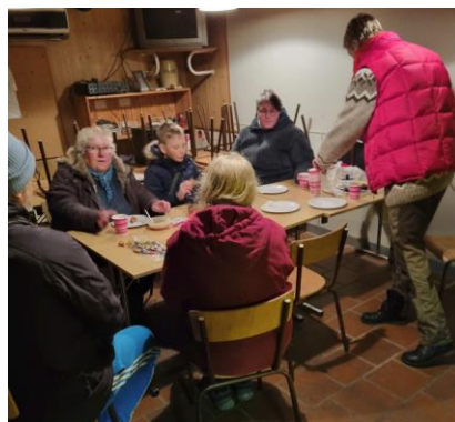
Fælles hygge i klubhuset