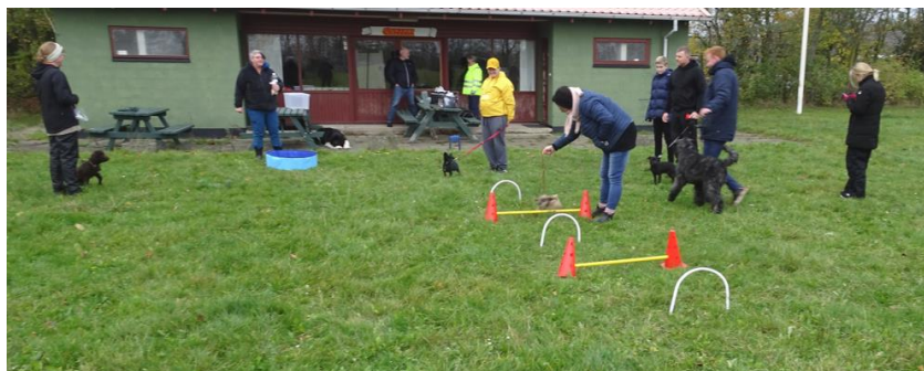
Hvalpehold 6 – "fortsættere" 12. december - "skovtur" ved Hylldalen