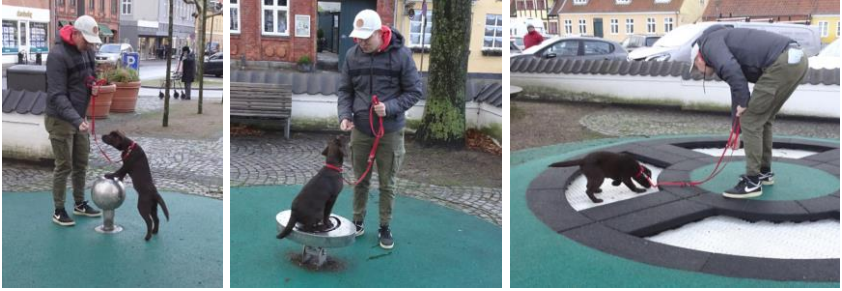
Aktiviteter på legeplads ved gavl af Det Gamle Rådhus