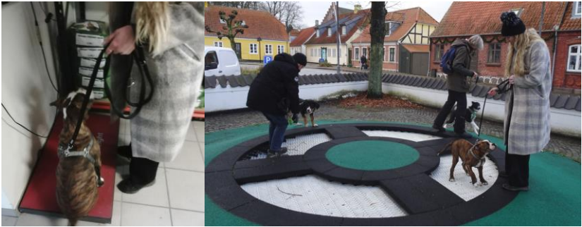
På vægten hos Børgesen