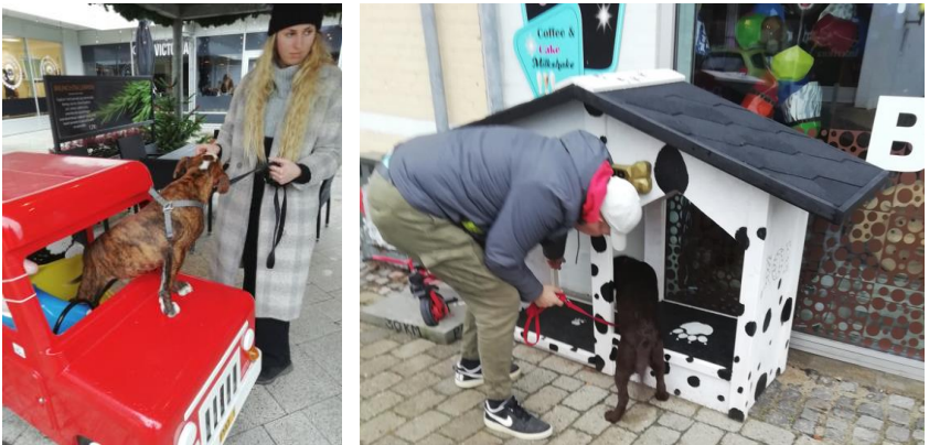
I Lollandscenteret og "hundehus" i Østergade