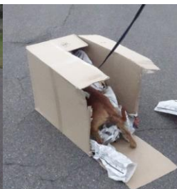
Søge i kasse