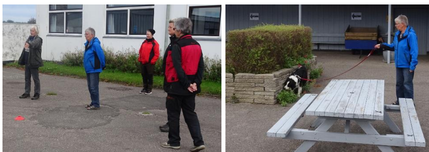
Jette fortæller hvad der skal forgå