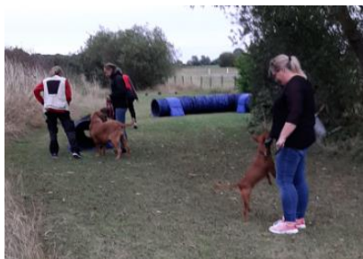
Kø ved aktiviteten "tunnel"