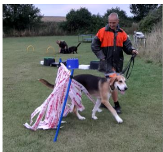
Igennem "ophæng" eller kikke over.