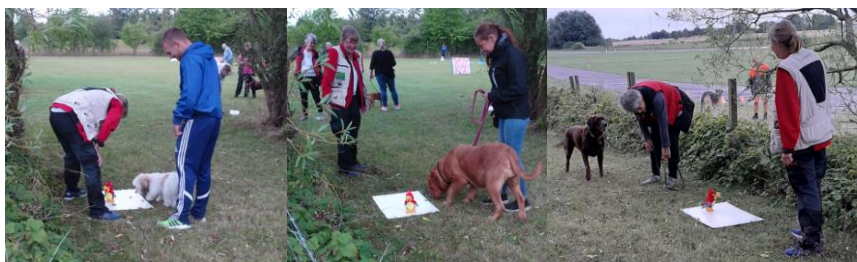
Her var en "snakkende" papegøje, der kunne bevæge sig.