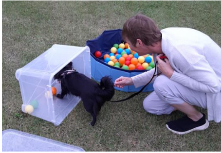
Søge mellem bolde