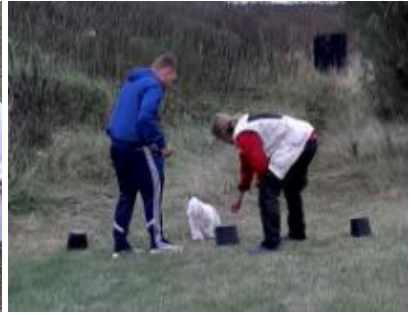
Finde hårdkogte æg under potter