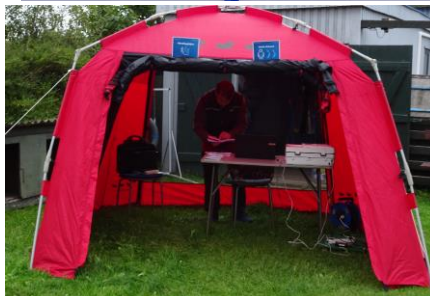
Rallybaner på dagen