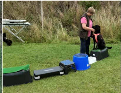
Balance hen over diverse baljer m.m med forskellige overflader