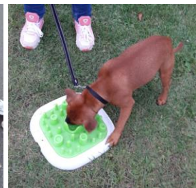
Godbidder i "layrint"