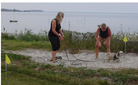
Træning ved Bandholm "nye" strand