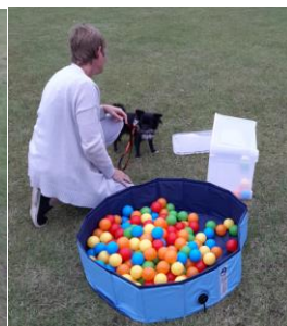
Søge i boldkasse